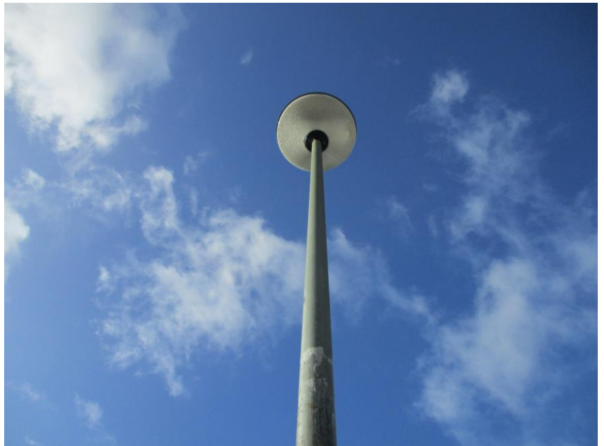
Een mooi voorbeeld van een kikkerperspectief door Emils en Salar.

Bij grappige perspectieven wordt de kijker een beetje in de boot genomen door middel van optische illusie. Als je weet hoe het moet is het vrij gemakkelijk te doen.